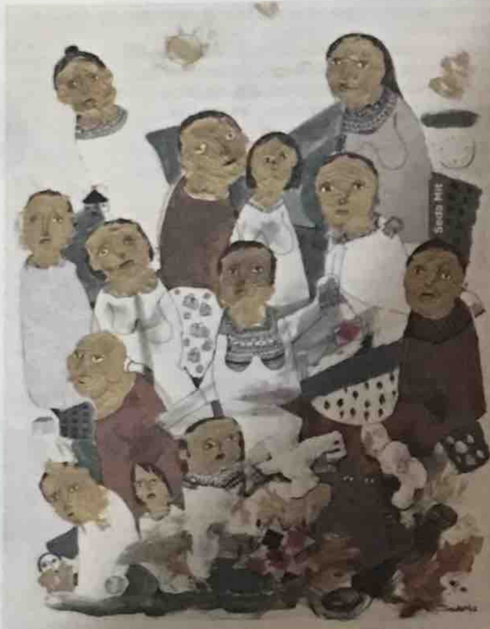
Koçak, Aylak Adam romanını ilk kent romanı olarak ilan ediyor. Ardından bu roman ile Geçgin'in eserlerini karşılaştırırken kentin, kent içindeki coğrafi alan seçiminin, emek süreçlerinin sergilenmesinin ve bu süreçlerin anlatımına geçiyor.

Koçak, Atılgan ile Geçgin arasındaki ilişkiyi bu şekilde anlatmayı seçerek bir öncelik ve sonralık ilişkisi sırasından ziyade metinlerin birbirleri arasında birçok yönden nasıl konuştuklarını ve kimi zaman Atılgan'ın kimi zaman Geçgin'in aynı zaman diliminde olmaları bile birbirlerine cevap verebildiklerini gösteriyor.