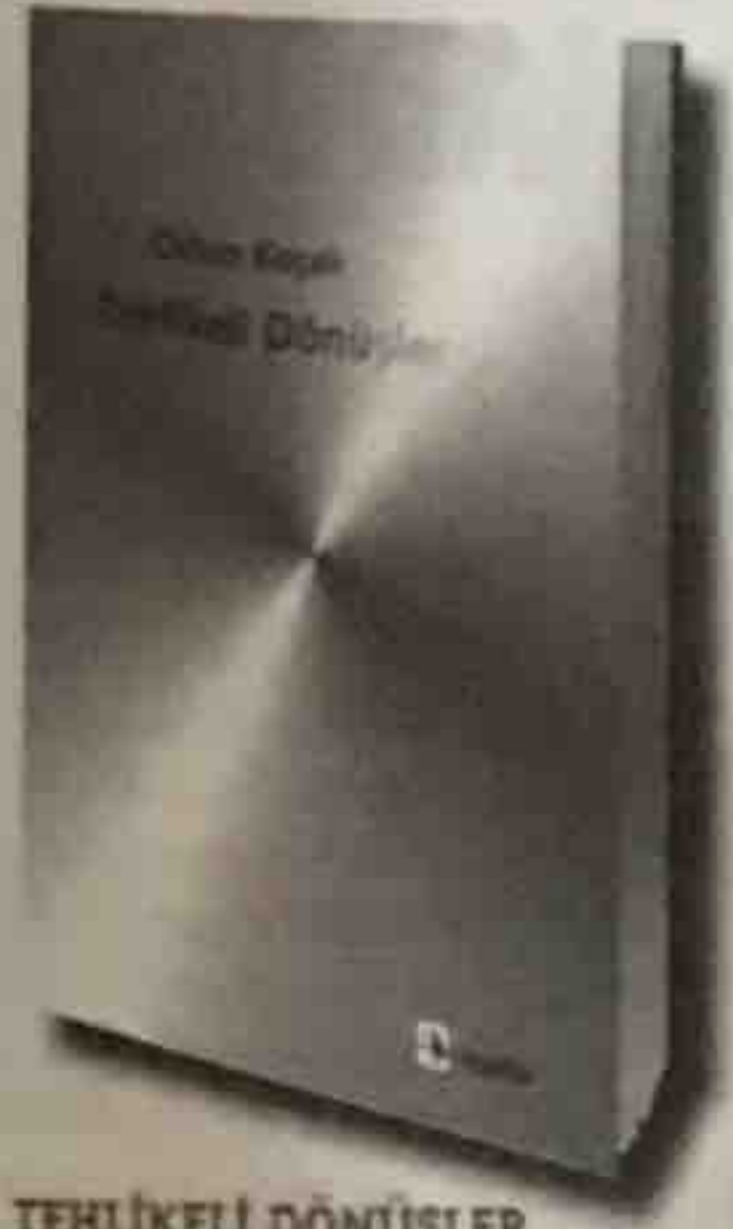
TEHLİKELİ DÖNÜŞLER Orhan Koçak Metis Yayınları

Tehlikeli Dönüşler , üzerinde uzun yıllar konuşulacak, tartışılacak son dönem Türkçe eserler üzerine yazılanlar arasında önde gelen kitapların başını çekiyor. Sadece Yusuf Atılgan ve Ayhan Geçgin'in eserleri hakkında değil Türkçede üslup, zaman, anlatım tekniği, kent ve kahraman arasındaki ilişkilere bakışta yepyeni tespitler yaparak eleştiri ortamında büyük bir hamle yaratıyor. ■