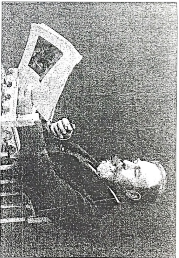
Recâizâde Mahmud Ekrem

Hakikati urefâ-pesendânesinin mâ-sadak meâlî olan Tevfik Beyefendi –ki âcısın renklere müstâğrak müzeyyen ve müzehheb bulutlarla muakkab olarak kemâlî datat ve ittisamıyla cihân-i manâya elvedaguyâ olan bugünkü mihr-i garib-i edebiyatın yarıncı şâsâ-i tulunu oyle bir sabâh-î feyz-â-feyziin kekkebeci-i ikbâlîne yakırsacak eşâr-i cân-şikâr-âhenk. El-hân-ı dîr-rübâ-yı ferheng ile istihâl için tetebü-yi kitabı-tabatı takbî-i fikr-i hikmetle tenmiye-i cevherân-ı subbân-ı üdehdâdan bir şiir-i zî-fazilet... Bir hukûk-perveri marifetir –zaten perişân evrâk-i bir-kymerten ibaret iken himmet-i kâk-i gayreyile bu seki-i mazbûyetü, bu sûret-i intizam ve matbuatı iktisâb etmiş olan Pejmürde 'yi takdiren neşide-i âtiyeyi ihdâ buyurdu. Ben de bil-iftilâh zîb-î hâtime-i kitab-ıttihâz etmekte çâkinmedim.